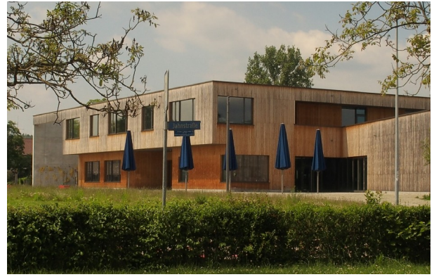
Campus Rheinfelden, gesehen ab Parkplatz Jahnstraße 1, D-79618 Rheinfelden (Baden)

Spielort Campus Rheinfelden , barrierefreier Neubau an der Jahnstraße 1 in 79618 Rheinfelden (Baden), kostenfrei parken am Campus, nahe Fußgängerzone mit Restaurants u. Einkaufsmöglichkeiten; Fußweg ab Bahnhof DB 20 Min., ab CH-SBB 25 Min.